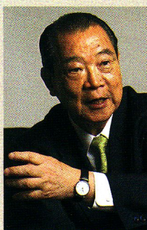
おまじろ 平野貞夫 1935年衆議院議員 ひらの 平野貞夫 1992-2004年参院議員

ある時は「あなた人を見る 目がない」と言うの。新学生 で僕が連れてきたのが後で離 れたもんだから。そいつが首 長選に出たとき2度応援に入 った。やはり気になるんだな。 仕事は全部自分でやるわ けない。だから、上に立つ者 は人を見る目が80%。小沢も それで散々苦労した。やつと いい人が揃ってきたけどな。